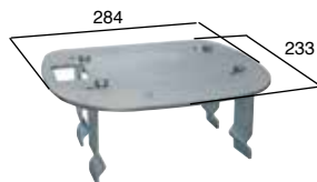
ACG8108 PIASTRA DI FISSAGGIO per K500 da interrare