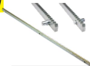
ACS9021 CREMAGLIERA M4 in metallo (sez. 30 x 12 mm) con distanziali tondi (fino a 2.000 kg) in barre da 1 m al m 17 €