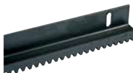
ACS9050 CREMAGLIERA M4 in metallo (sez. 22 x 22 mm) rivestita con CATAFORESI, con angolare (fino a 2200 kg) in barre da 2 m al m 46 €