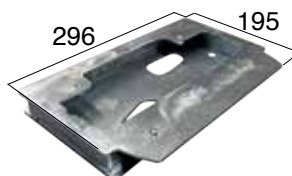
ACG8117 PIASTRA DI FISSAGGIO adattatore CAME BX per K500