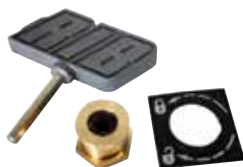
ACG8672 SERRATURA DI SBLOCCO CON CHIAVE ESAGONALE